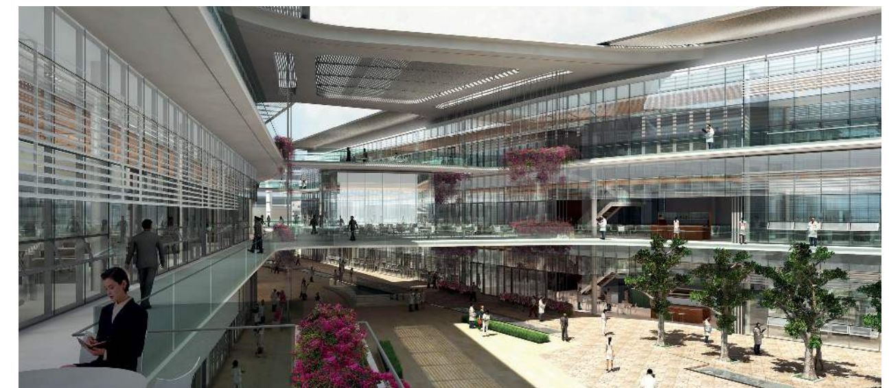
Centro di Ricerca Biomedica Ri.MED - HOK con Progetto CMR

In ogni caso, teniamo a precisare che oggi molti progetti in ambito sanitario vengono realizzati grazie ad una combinazione di finanziamenti pubblici e privati, con la costi-