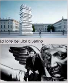
La Torre dei Libri a Berlino