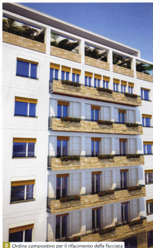
2 Ordine compositivo per il rifacimento della facciata