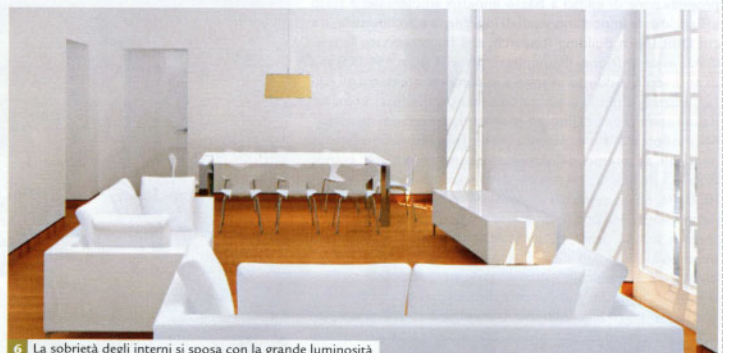
6 La sobrietà degli interni si sposa con la grande luminosità