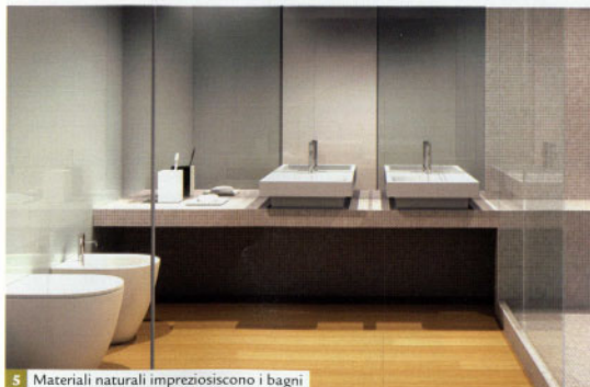
5 Materiali naturali impreziosiscono i bagni