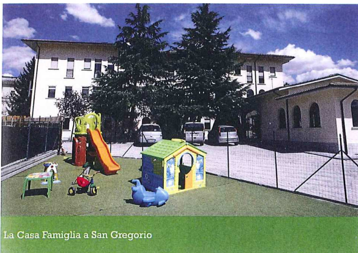
La Casa Famiglia a San Gregorio